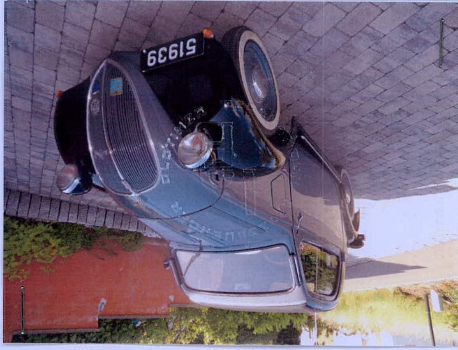
Photograph of vehicle in present form La photo du véhicule dans la forme présente

Remarks, modifications, history, etc. - see page 4. Remarques, modifications, histoire, etc. - voir page 4.